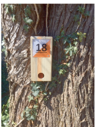
Balise à trouver